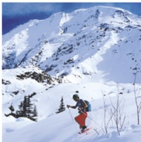
Y. Jacquemoud bureau des guides

Difficulté : .....facile à partir du Crêt devant Altitude la plus haute : .....1 200 m Départ : .....parking de l'Espace Animation .....(passage technique au départ) Ou le Charpelet Devant, si les champs au départ .....de l'Espace Animation ne sont pas enneigés. Temps : .....2h