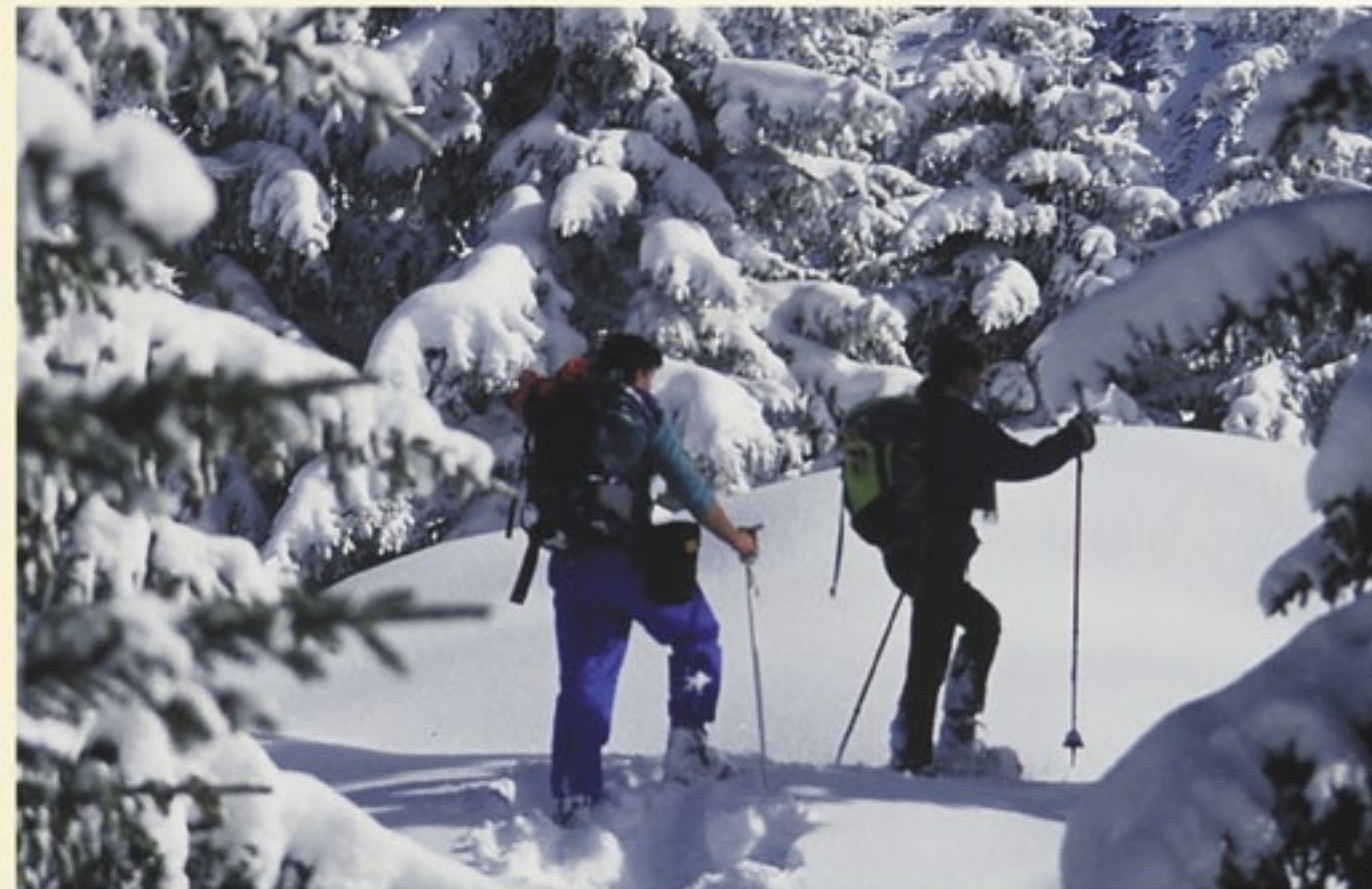
Y. Jacquemoud bureau des guides